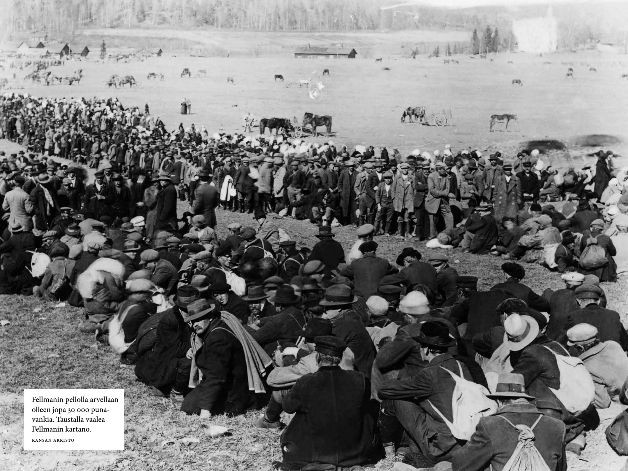
Fellmanin pellolla arvellaan olleen jopa 30 000 punavankia. Taustalla vaalea Fellmanin kartano.