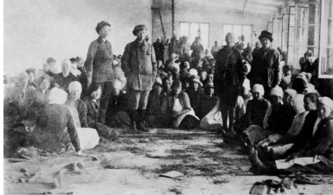
Naissotilaita vankeina Rautateollisuuden tehdassalissa. Kuvan naisista enemmistö murhattiin Mustankallionmäellä.