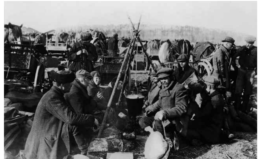
Vangit keittävät piilottamistaan elintarvikkeista ruokaa Fellmanin pellolla.