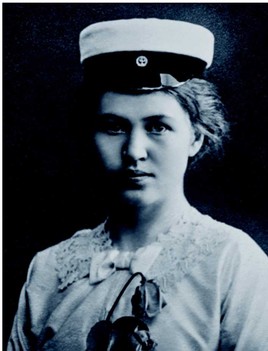
Ainon ylioppilaskuva vuodelta 1913.