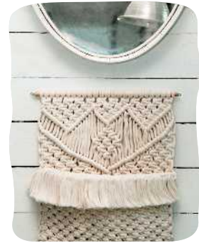
SEINÄ- TASKU 84