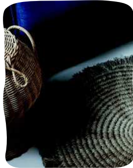
PIENI MATTO 94