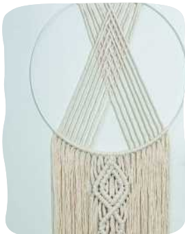
UNELMA- SIEPPARI 109