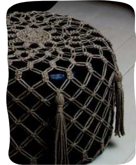
RAHIN PÄÄLLINEN 102