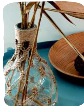
PULLON KORISTE- PUNOS 117