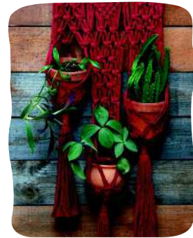
USEAMMAN RUUKUN SEINÄ- AMPPELI 35