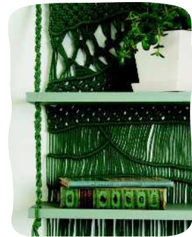
SEINÄ- HYLLY 60