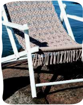
KANSI- TUOLI 67