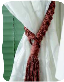
VERHO- TAMPPI 81