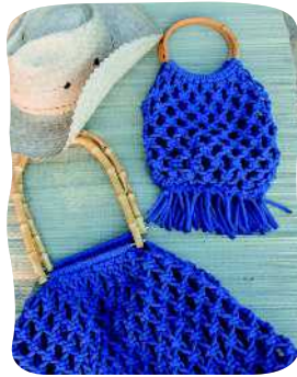
VERKKOKASSIT ÄIDILLE JA LAPSELLE 72