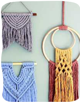
PIENET SEINÄ- KORISTEET 40