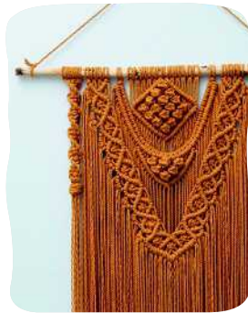
OSISSA SOLMITTU SEINÄVAATE 49