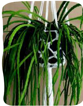
METALLI- RENGAS- AMPPELI 23