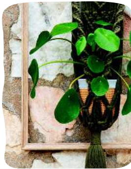
KEHYKSEEN SOLMITTU AMPPELI 28