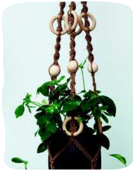
PUU- KORISTEINEN AMPPELI 17