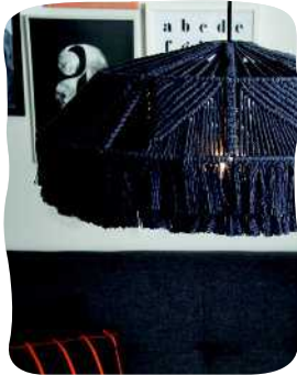
LAMPUN- VARJOSTIN 91