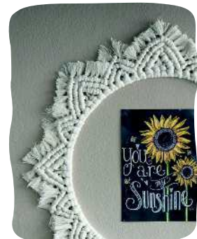
PYÖREÄ KEHYS 122