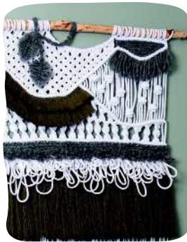
SEINÄVAATE ERI LANGOILLA 54