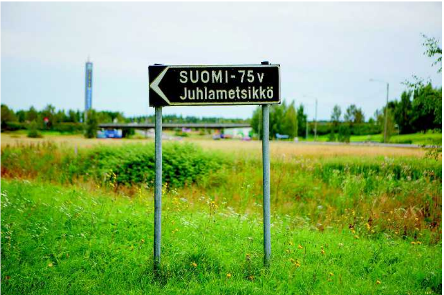
Suomi - 75 v Juhlametsikkö, Jalasjärvi.