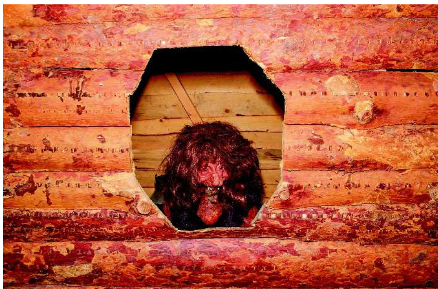
Peikko Nokkakiven huvipuistossa.