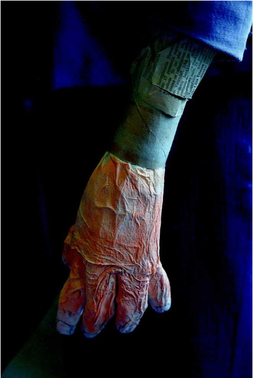
Yksityiskohta Killinkosken palokuntamuseossa.