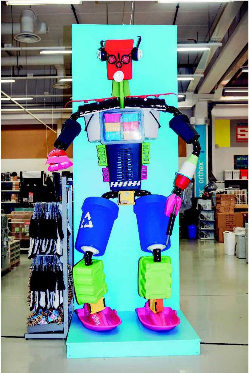
Ämpärirobotti Tuurin kyläkaupassa.