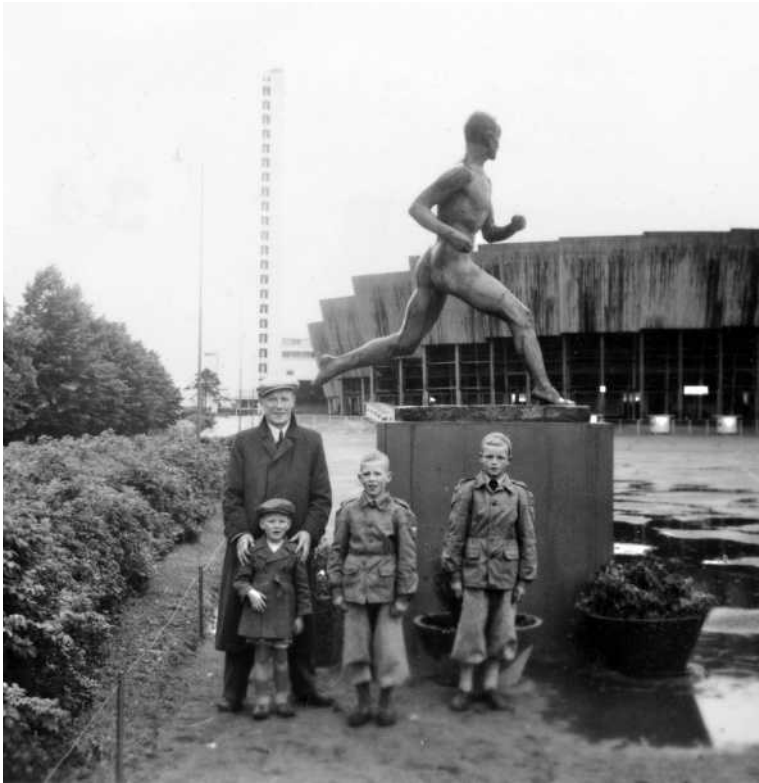
Kesäretkellä Helsingissä. Stadion nähty, seuraavana kohteena vasta-avattu Linnanmäen huvipuisto.

Olen joskus ihmetellyt, miksi isä ja äiti eivät juuri puhuneet menneisyydestään. Tuskinpa siellä mitään salattavaa oli, ja olenkin ajatellut sen johtuneen nuorena koetusta sota-ajasta. Pommitusten, suru-uutisten ja yleisen epävarmuuden keskellä har-