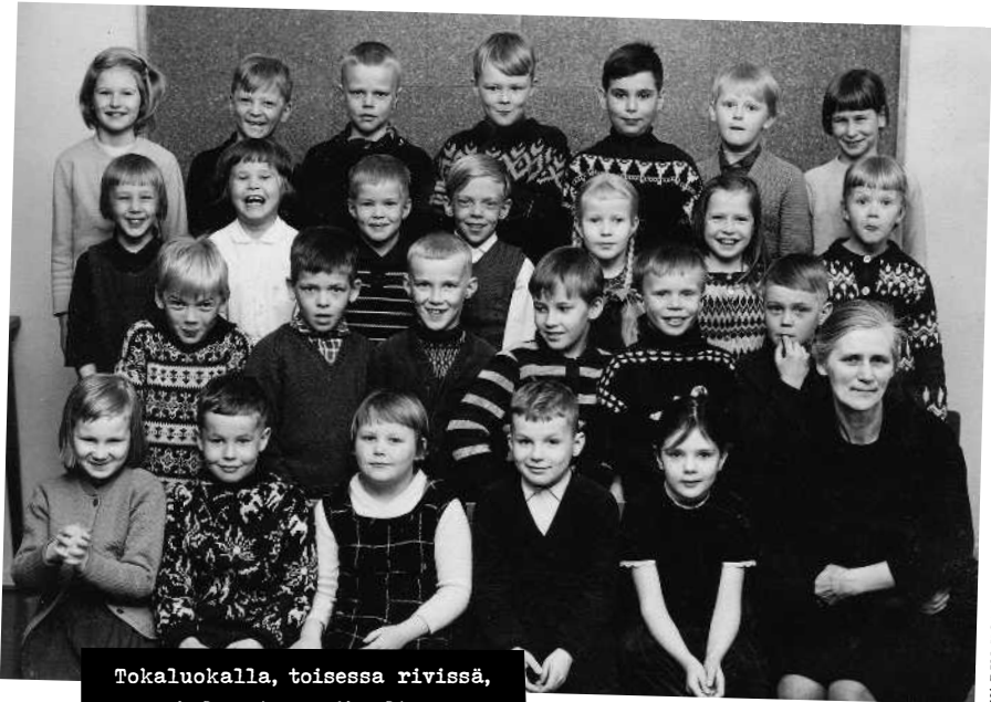
Tokaluokalla, toisessa rivissä, kolmantena oikealta.