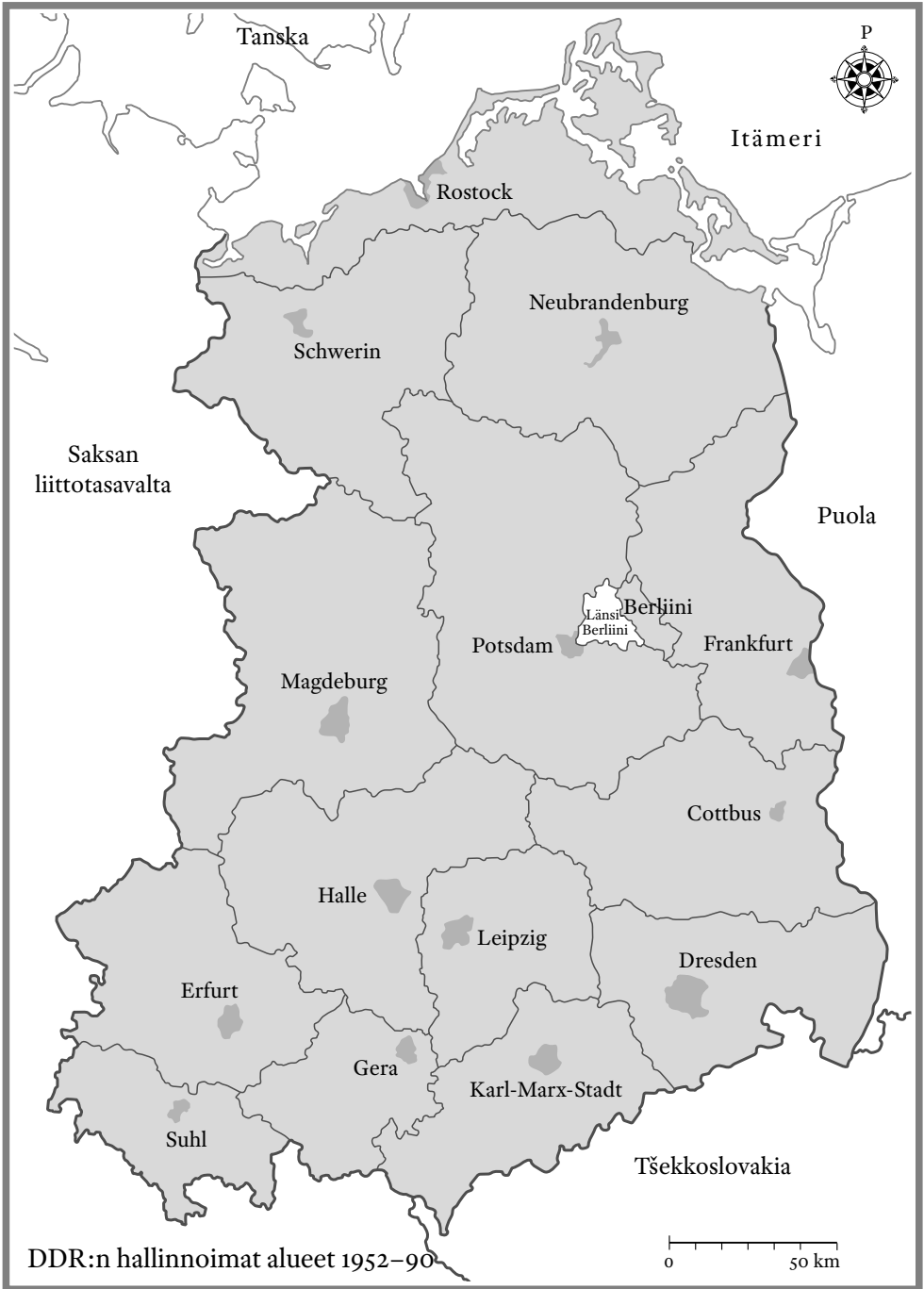
DDR:n hallinnoimat alueet 1952–90