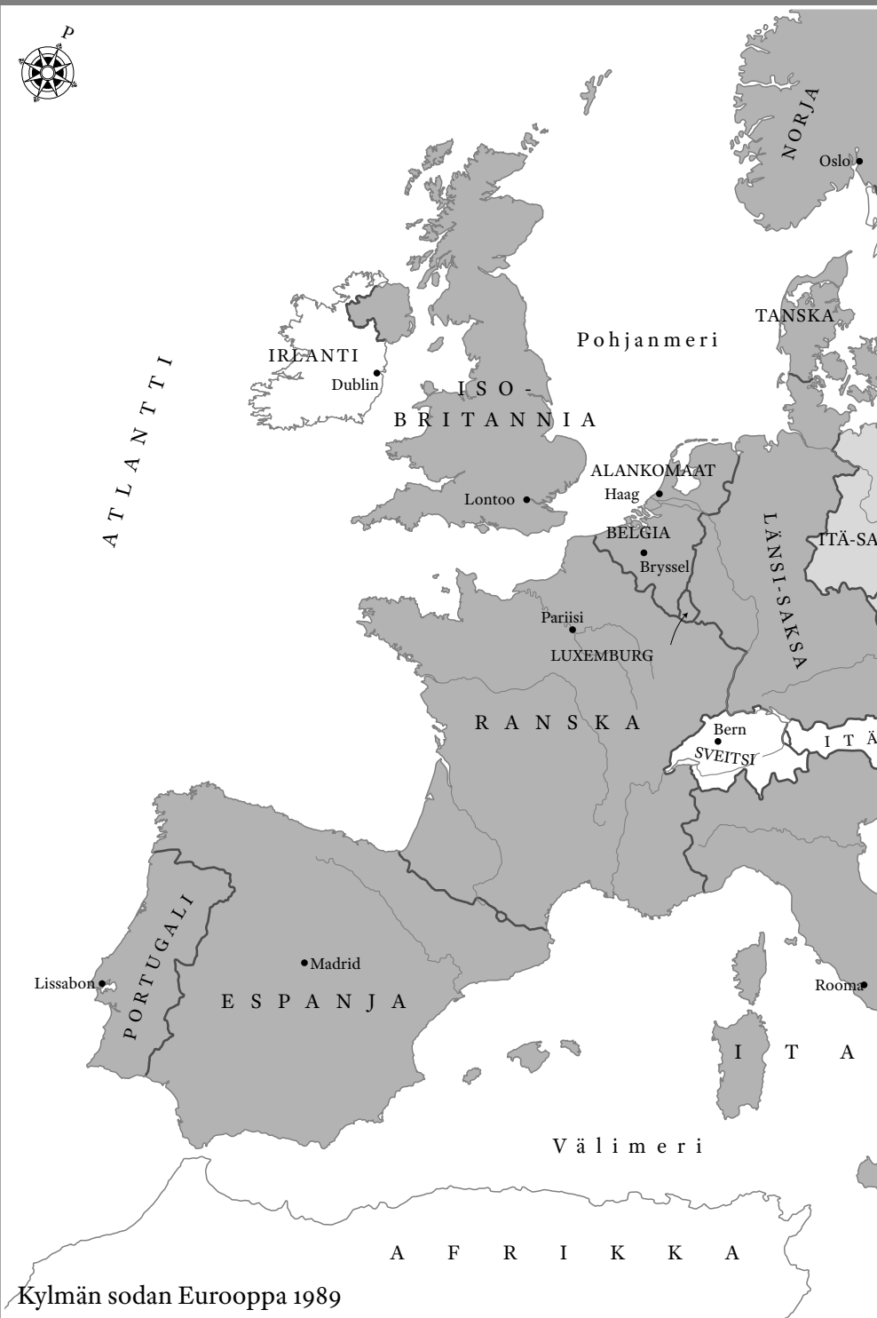
Kylmän sodan Eurooppa 1989