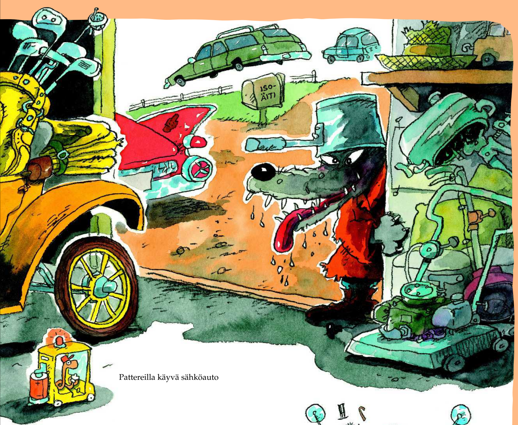
Pattereilla käyvä sähköauto

– Astu sisään, ovihan on auki, isoäiti sanoi. Ja siinä samassa susi loikkasi isoäidin luo, kaappasi tämän kainaloonsa ja tunki suureen tavarasäiliöön.