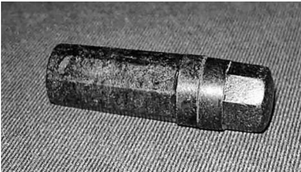
M/41 oli yleisin neuvostoliittolainen tunnistusriipusmalli.

Toisinaan myös puna-armeijan sotilaan saattaa tunnistaa nimitoidun esineen avulla, mikäli tappioluettelo on saatavissa ja siinä on vain yksi nimeen tai nimikirjaimiin sopiva henkilö. Mutta jos sukunimi on yleinen ja taistelupaikalle on jäänyt monta vainajaa, tunnistaminen on useimmiten mahdotonta. Pakkeja ja muita nimitoituja esineitä vaivaa samaa haaste kuin suomalaisillakin: ei ole varmaa, ovatko ne kuoleman koittaessa enää olleet sillä sotilaalla, joka kaiversi niihin nimensä.