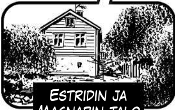
ESTRIDIN JA MAGNARIN TALO