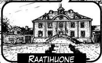
RAATIHLUONE JA TORI