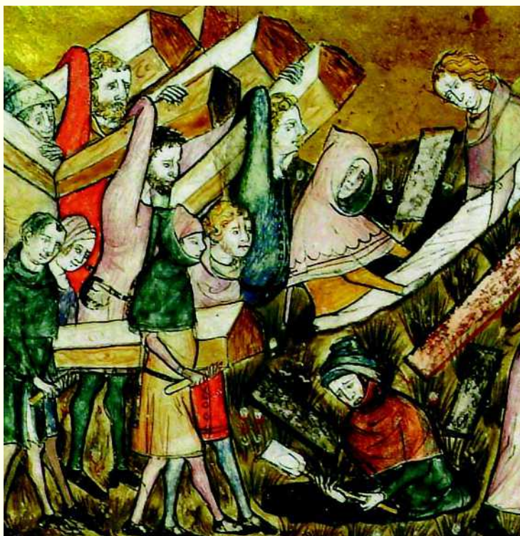
Mustaksi surmaksi kutsuttu rutto näkyy myös aikakauden taiteessa.

Musta surma oli saapunut Italiaan vuonna 1347, ja se oli levinnyt valtavaa vauhtia yli Euroopan. Taudin ensimmäinen aalto saapui Ruotsiin vuonna 1350, ja sen arvioidaan surmanneen yli 250 000 ruotsalaista. Toinen aalto levisi Euroopassa vuodesta 1360 alkaen ja kolmas aalto vuodesta 1369 alkaen. Kaksi kolmas-