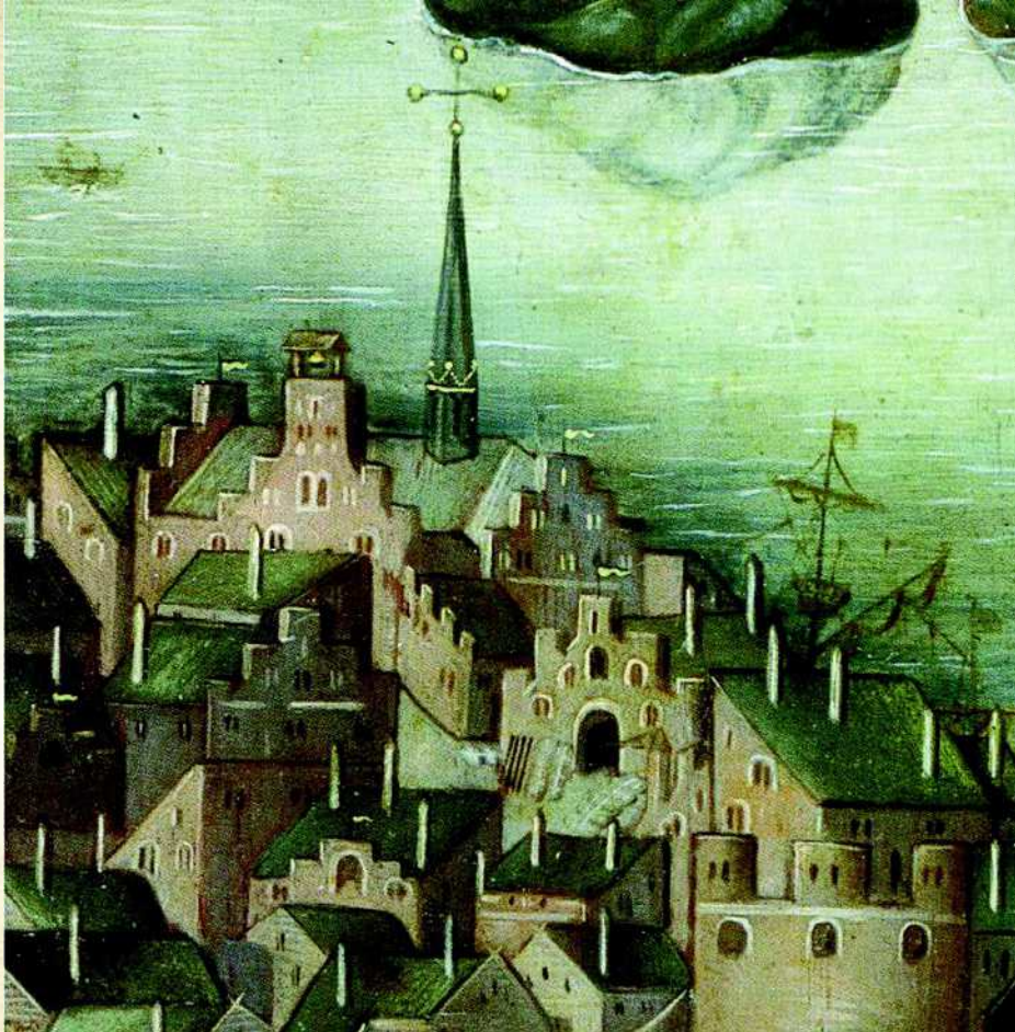
Dominikaaniluostarin kirkko Tukholmassa 1500-luvulla.