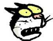
Rieti, 12 v. Kissa (ei sit)