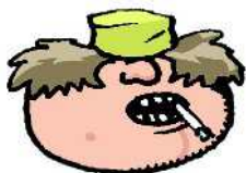
Riitta, 56 v. Kahvilatyöntekijä, Kahvila Aromi (komm)