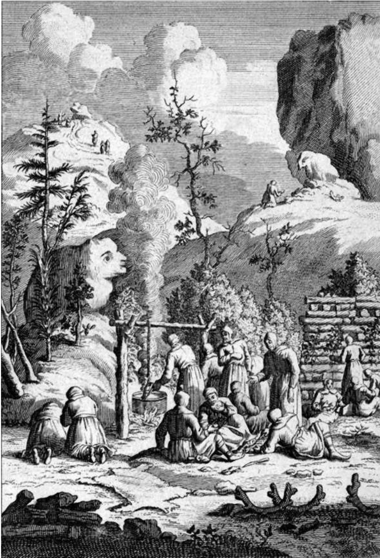
Saamelaisten seidanpalvontaa vuonna 1728 ilmestyneessä teoksessa Cérémonies et coutumes religieuses de tous les peuples du monde . Seidan palvojat ovat kerräntyneet keittämään uhriateriaa ihmispiirteisen seitakiven juureen.

vähemmän mahtavina kuin seitakiviä. Monet seidat ovat olleet vain yhden suvun käytössä, mutta tärkeät seidat ovat olleet koko siidan eli saamelaisen paikallisyhteisön yhteisiä kulttipaikkoja. Saamelaiskulttuurissa seidoille uhraaminen kuului vain miehille, koska miehet vastasivat elannon hankkimisesta.